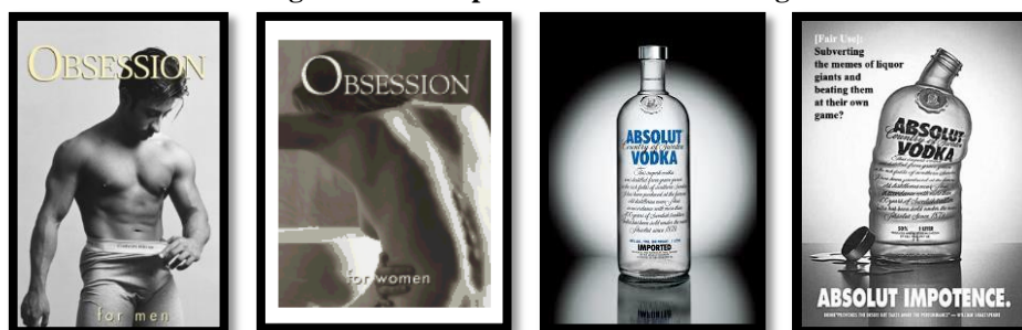
Figura 2 – Exemplos de Culture Jamming

Ainda segundo o autor, a Culture Jamming parece, portanto, ser uma prática social herdeira da contracultura, porém, com peculiaridades que a aproximam de uma subversão pós-moderna, ou seja, contemporânea. Também são manifestações que não recusam a mídia, ao contrário, se valem dela inclusive para subvertê-la. Se por um lado os jammers chamam a atenção para a dominação cultural das grandes marcas no espaço midiaticizado, por outro questionam também o próprio funcionamento midiático da cultura, quando promovem uma interferência no próprio meio e na mensagem que ele produz. Essas interferências podem ser produzidas através de várias formas como: uma simples pichação em um banner ou um outdoor publicitário, quanto através de impressão e veiculação de peças publicitárias parodiadas; com o Street Bubbles, balões que são preenchidos, recortados e impressos para serem colados nos anúncios publicitários localizados nos espaços urbanos; ou ainda as paródias que consistem em recriar uma peça publicitária semelhante a original, porém com uma mensagem completamente diferente da primeira. Geralmente as mensagens criadas pretendem denunciar algo que não está dito pela publicidade, ou até mesmo revelar o que está por trás da imagem que está tentando ser fabricada para determinada marca.