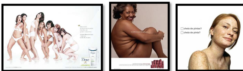
Figura 3 – Campanha Dove pela Real Beleza