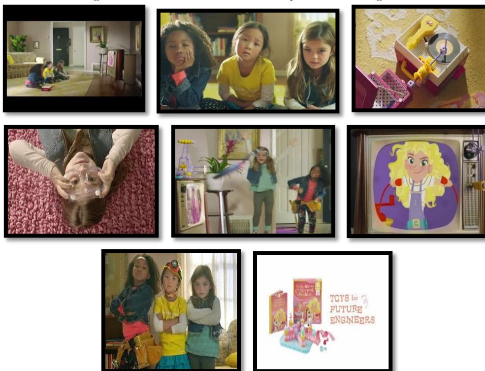
Figura 6 - Comercial GoldieBlox – Toys for future engineers

No vídeo, três meninas estão entediadas assistindo a anúncios de brinquedos com princesas cor-de-rosa na TV. Então elas pegam uma caixa de ferramentas, óculos de proteção, um capacete e começam a construir uma máquina de Rube Goldberg, que manda para os ares xícaras rosas e bonecas, usando guarda-chuvas, escadas e, claro, brinquedos da GoldieBlox.