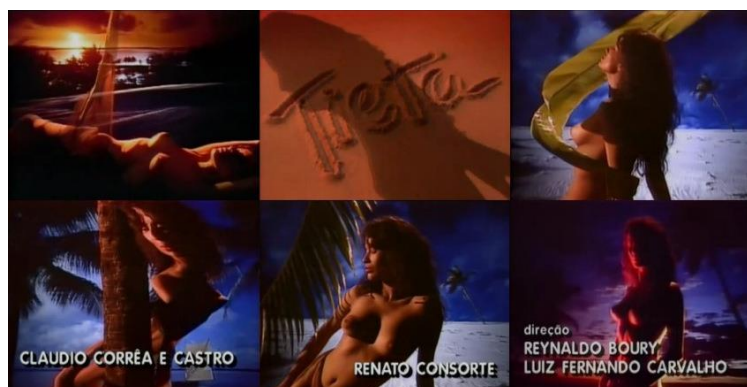
Figura 1 – Imagens da vinheta de abertura de Tieta

mangue seco, uma aldeia ao norte da Bahia, foram utilizadas como pano de fundo. (online) 5