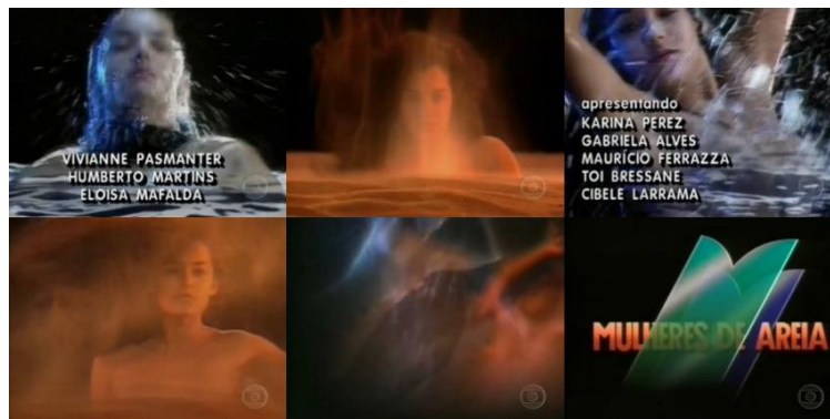
Figura 2 – Imagens da vinheta de abertura de Mulheres de Areia